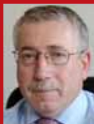
Ignacio Fernández Toxo Secretario general de CCOO