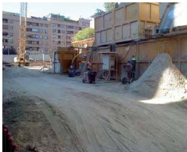
Estado actual del recinto histórico ajardinado después de la intervención de las excavadoras

La Memoria histórica no olvida. "Tan imposible como vencer la congoja, el ultraje retrospectivo que no mitigan los años, es eludir la obscuridad de los símbolos. En el lugar donde tan poco tiempo atrás resplandeció brevemente lo mejor de la vida y de la inteligencia española se celebra con toda solemnidad el aquelarre del Viva la Muerte" (Muñoz Molina).