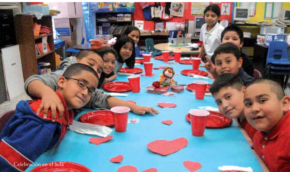
Celebración en el aula

El programa de profesores visitantes me brindó la oportunidad de desarrollar mi labor como docente en Estados Unidos, y a su vez me permitió obtener un aprendizaje a nivel humano incalculable. Recuerdo a mis alumnos y alumnas con mucho cariño y aunque soy consciente de que les espera una vida muy dura y sin recursos en muchas ocasiones, deseo que mi insistencia en que mantuvieran y se desarrollaran en su lengua y cultura haya dado su fruto, conduciéndolos hacia una vida mejor.