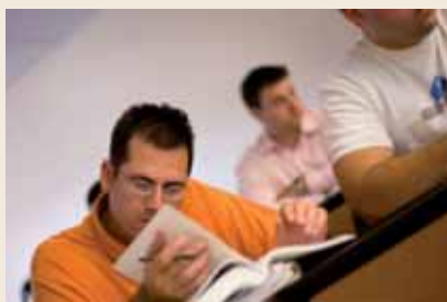
Oposiciones en la enseñanza

Por otro lado, se prevé que el próximo año se produzca número más