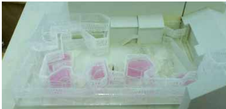
Maqueta del Proyecto de la Fundación Giner

Ahora nos explicamos el por qué de la limpieza integral , no sólo se quiere eliminar pabellones históricos, también el ambiente laico y científico de la Institución. No hubiera sido más digno tirarlo todo, sin falacias ni disimulos?