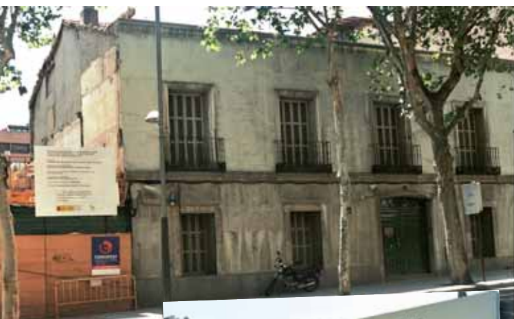
▲ Casa de Giner y Cossío en Martínez Campos 14, con el cartel que anuncia las obras.