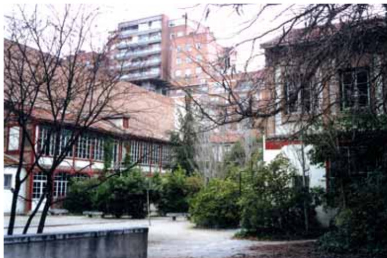
Recinto histórico arquitectónico de la Institución Libre de Enseñanza. Pabellón Macpherson, Parvulario y jardín.