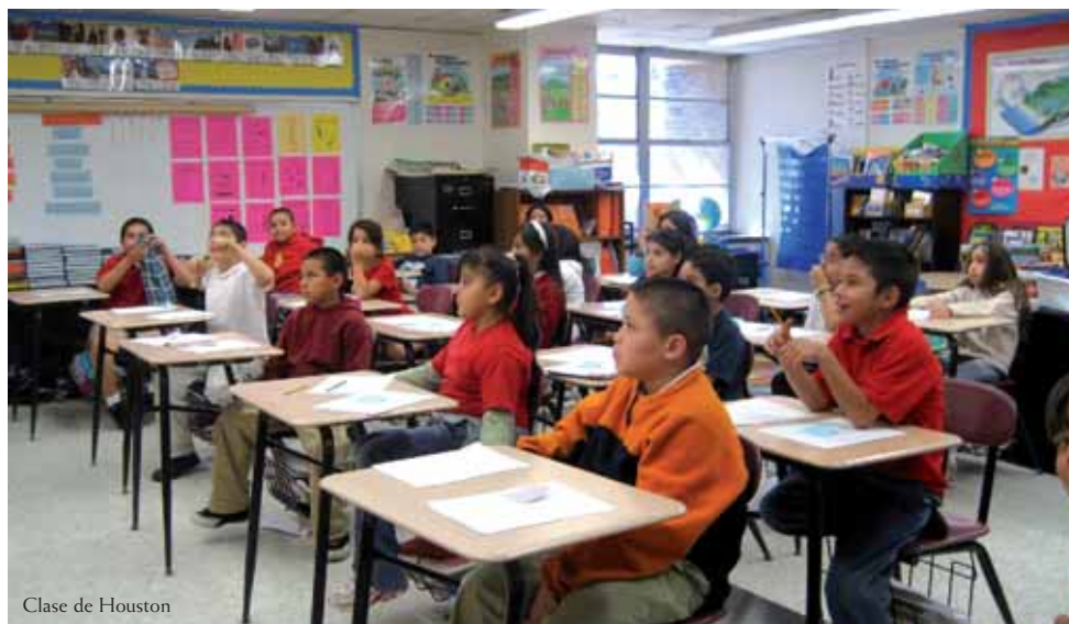
Clase de Houston

La mayoría de los alumnos del centro eran afroamericanos, siendo la proporción de alumnos hispanos un 10%. Los alumnos caucásicos en el centro eran una minoría no muy significa-