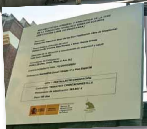
▶ Detalle del cartel anunciando el Plan de rehabilitación y ampliación de la Fundación Giner